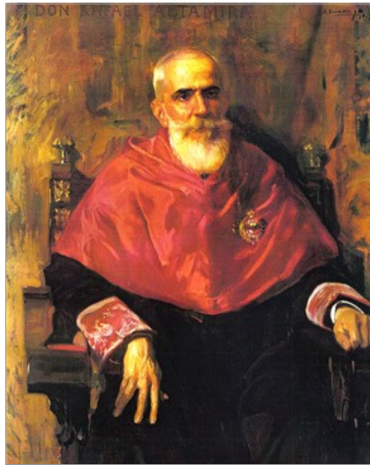
RETRAT DEL JUGE RAFAEL ALTAMIRA I CREVEA, DE JOAQUIM SOROLLA, 1913

A l'esclatar la guerra civil, en 1936, viaja a Holanda , a on residirà durant el periodo del conflicte. D'ací viajarà a França , més tart a Estats Units i definitivament s'establirà en Mèxic , a on falliria l'any 1951. Patix profundament les carències culturals del poble espanyol; en El patriotismo y la Universidad escriu: "Un poble que no respecta les opinions, ni creu als que pensen diversament ad ell, no és un poble lliure, sino una massa esclava dels seus propis prejuïns".